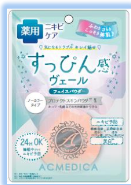
クリア (ノーカラータイプ)