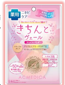
ナチュラル (ナチュラルタイプ)