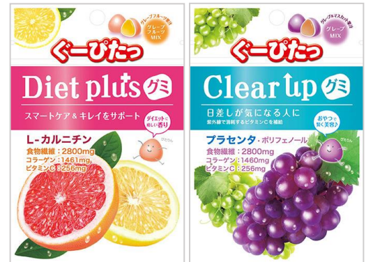
美容・健康食品で主成分としてとりたい成分

合し、女性の美容をサポートするという特長が評価され、売上を順調に伸ばしております。この度、さらなる売上拡大を目標に、スマートケア&キレイをサポートする「ダイエットプラスグミ」と紫外線が気になる人に～消耗する栄養を補給する～「クリアアップグミ」をそれぞれの機能と成分を大きく表示し、お客様により機能が伝わるパッケージにリニューアルし発売いたします。