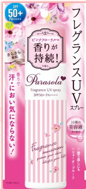
パラソーラ フレグランス UVスプレー

④: 10種美容液成分配合! ナノヒアルロン酸(加水分解ヒアルロン酸)、ナノコラーゲン(加水分解コラーゲン)高浸透型ビタミンC誘導体(パルミチン酸アスコルビルリン酸3Na)、セラミド、アミノ酸(セリン)、コエンザイムQ10(ユビキノ)、ローヤルゼリーエキス、ハイビスカス花エキス、ザクロ果実エキス、カミツレエキス