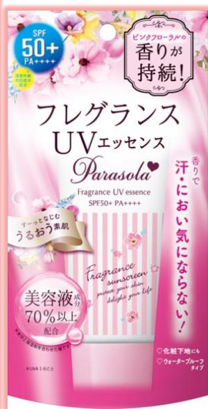
パラソーラ フレグランス UVエッセンス